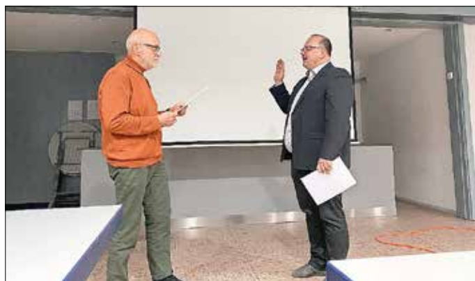
Abnahme des Amtseides.