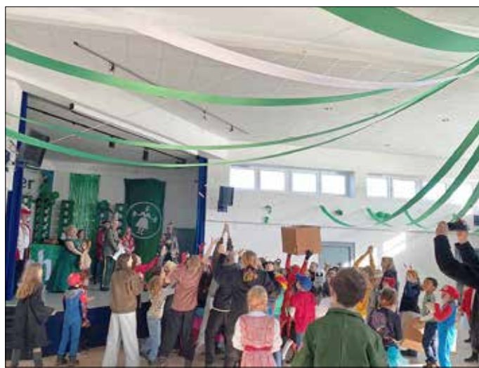
Richtig was los! Die Kinder der Grundschulen Halsdorf und Wohra feiern im Bürgerhaus.

Pünktlich um 09:33 Uhr waren die Türen des Bürgerhauses von fast 100 Kindern belagert, die nur ein Ziel verfolgten: Die aufgebauten Sperrn, Mauern und Barrikaden zu durchdringen, Bürgermeister Dawedeit den Schlüssel zu entreißen und das Bürgerhaus zu übernehmen. Unterstützung bei der Erstürmung erhielten die Kinder durch das amtierende Wohrataler Prinzenpaar Bibi I. und Uwe I. und ihrem Hofstaat mit Gefolge, die die Kinder mit Musik und Gesängen anfeuert.