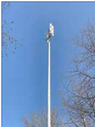
Neues Aussehen und verbesserte Funktionen. Die neue Sirene am Feuerwehrgerätehaus Wohra.

Die Umrüstung der Sirenen erfolgte durch eine Fachfirma, die die Installation der neuen Sirenensteuerungen an den vier Feuerwehrhäusern vornahm. Am Feuerwehrgerätehaus in Wohra wurde darüber hinaus ein neuer Sirenenmast unter Mitarbeit des Bauhofes errichtet.