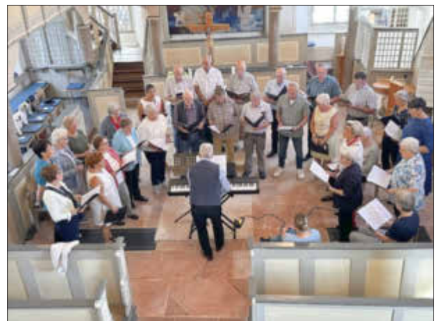
Der Gemischte Chor 1873 Halsdorf lud seine Gäste zum Mitsingen in der Halsdorfer Kirche ein.