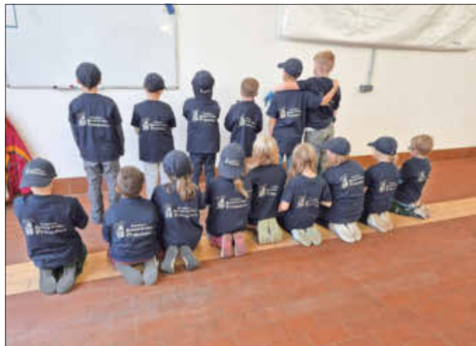
Große Freude über die Shirts und Cappies, die Dank der Spende des Teams der Kleiderkammer angeschafft werden konnten!