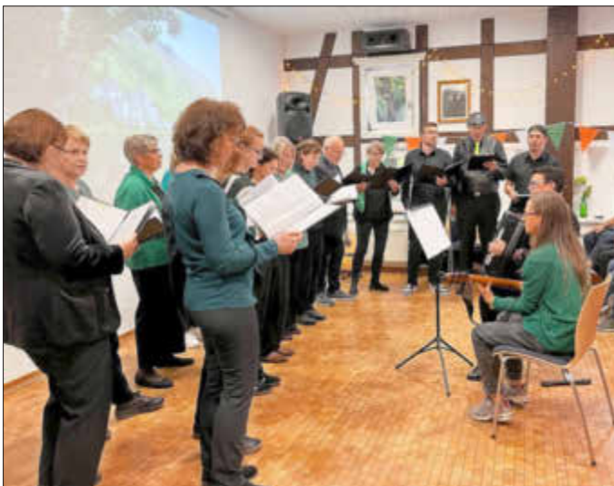
Die Gäste des GSV Kleinseelheim begeisterten mit ihren Liedbeiträgen. Bild und Text: Privat.