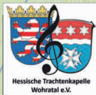
Hessische Trachtenkapelle Wohratal e.V.

* 16.08. 100 Jahre FFW Wohra * 28.09. Erntedankfest