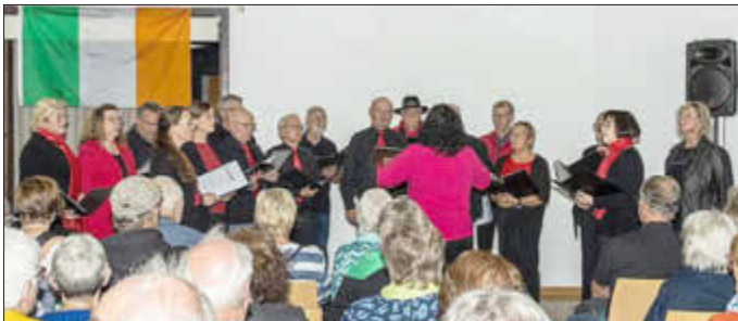
Auch die Rose-Valley-Singers aus Rosenthal ließen ihre Stimmen in der Dorfscheune erklingen.