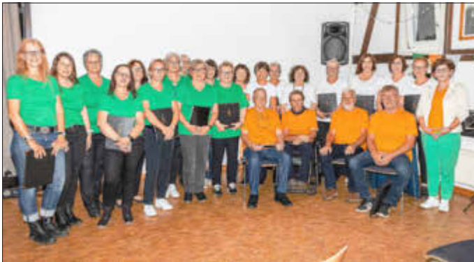
Der gastgebende Prosecco-Chor trat in den Farben der irischen Flagge auf.

Ein Abend voller Freude am Singen, Zuhören und geselligem Zusammensein hat die Erwartungen der Veranstalter übertroffen. Der irische Abend des Prosecco-Chors Langendorf ging damit als gelungene Veranstaltung zu Ende – ein Fest, das die Stimmen und die Gastfreundschaft der Region noch lange in Erinnerung behalten lässt.