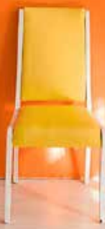
Grafik: Volkshochschule Marburg-Biedenkopf