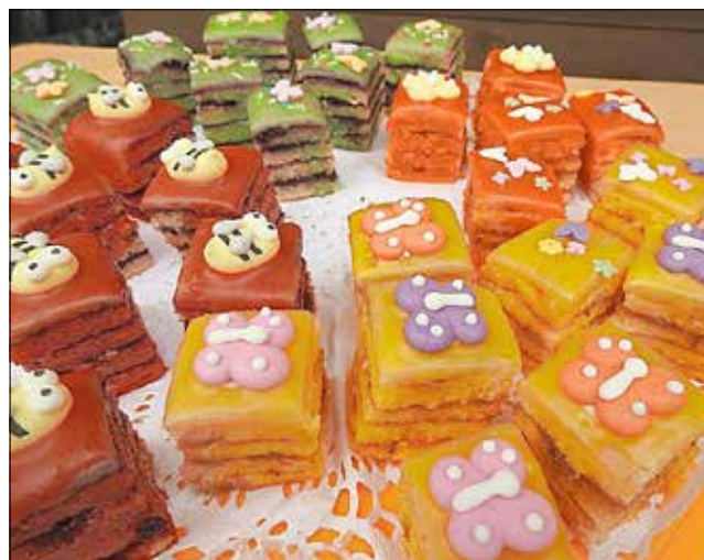
Süße Bienen-Power – eine gelungene Überraschung